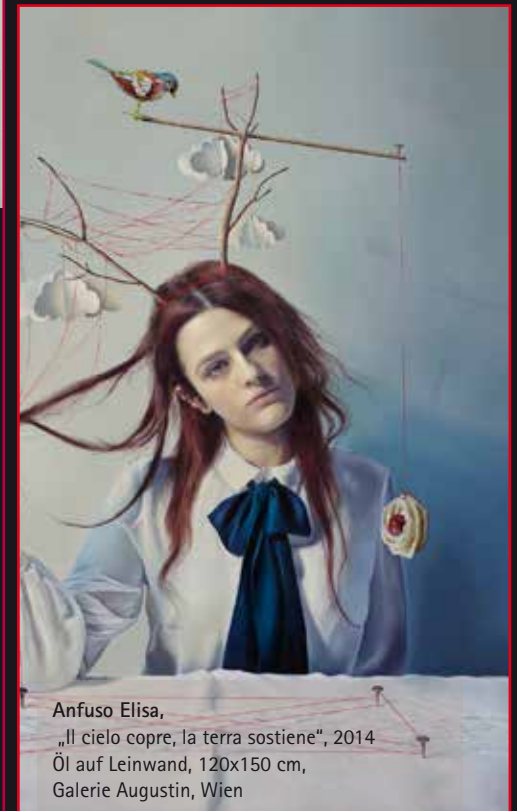
Anfuso Elisa, „Il cielo copre, la terra sostiene“, 2014 Öl auf Leinwand, 120x150 cm, Galerie Augustin, Wien