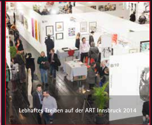
Lebhaftes Treiben auf der ART Innsbruck 2014

Nominiert für den Bank Austria Kunstpreis 2013