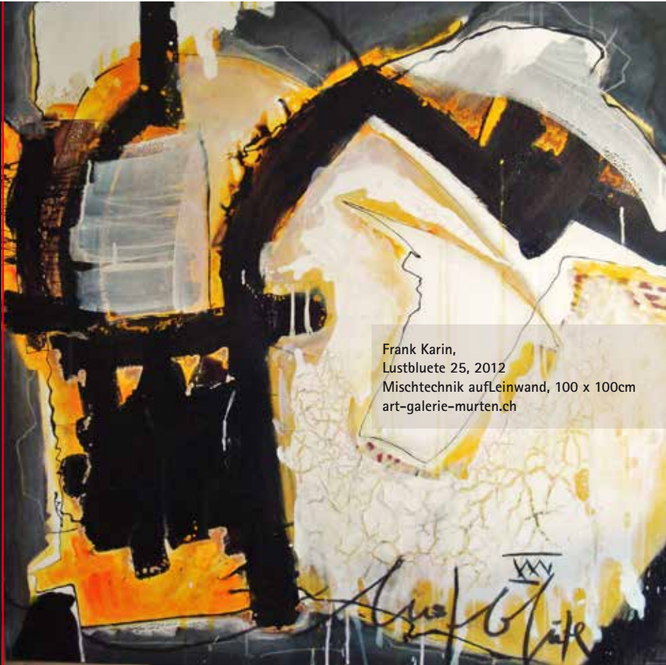
Frank Karin, Lustbluete 25, 2012 Mischtechnik auf Leinwand, 100 x 100cm art-galerie-murten.ch